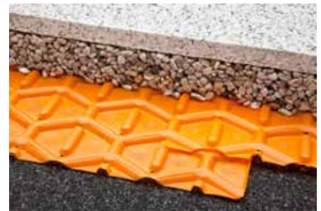
Overlapping van Schlüter®-TROBA