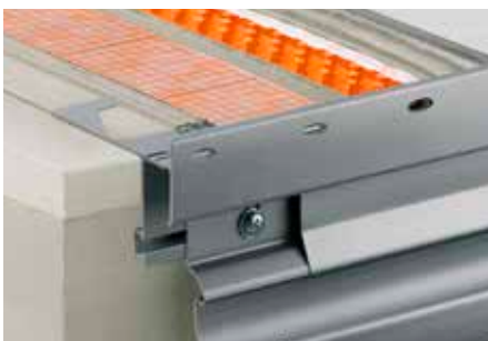
Opbouw met Schlüter-DITRA-DRAIN 8 en Schlüter-BARA-RTKE 23