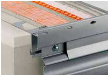
Opbouw met Schlüter-DITRA-DRAIN 4 en Schlüter-BARA-RTKE