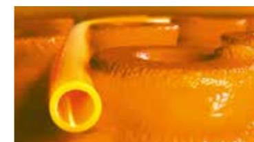
Schlüter®-BEKOTEC-THERM de klimaatregelende tegelvloer.