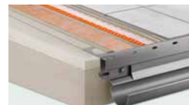
Schlüter®-balkonsystemen complete oplossing voor nieuwbouw en renovatie van balkons en terrassen.