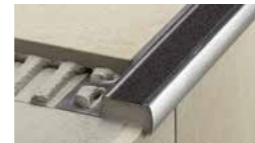
Schlüter®-TREP antislip trapprofielen.