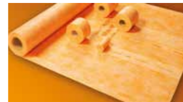
Schlüter®-KERDI een betrouwbare afdichting in een handomdraai aan te brengen.