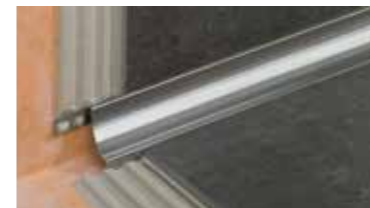
Schlüter®-DILEX profielsysteem voor duurzaam onderhoudsvrije bewegings- en randvoegen.

Wilt u meer weten over de andere Schlüter-producten en -systeemoplossingen voor de tegelzetter? Vraag dan naar één of meer van de volgende folders in onze verkooppunten. U kunt ook terecht op onze website: www.schlueter-systems.nl .