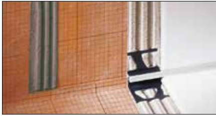
Schlüter®-KERDI-200 / -KERDI-DS Voor afdichtingen in combinatie met tegelbekledingen aan de wand en op de vloer