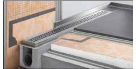
Schlüter®-KERDI-LINE Complete set voor lineaire inloopdouche