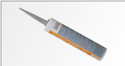
Schlüter®-KERDI-FIX Geschikt voor het verlijmen en afdichten van aansluitingen van de Schlüter-KERDI afdichtingsmat