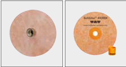
Schlüter®-KERDI-KM / -MV Manchetten voor buisdoorvoeringen