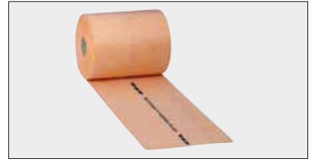
Schlüter®-KERDI-FLEX Flexibele afdichtingsband voor het afdichten van bewegingsvoegen