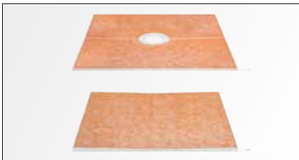
Schlüter®-KERDI-SHOWER zijn modulaire systemen voor inloopdouches met keramische tegels. Hellingsplaten systeemconform voor de centrale afvoer Schlüter-KERDI-DRAIN of voor de lineaire afvoer Schlüter-KERDI-LINE zijn te verkrijgen in verschillende afmetingen.