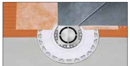
Schlüter®-KERDI-DRAIN Vloerafwateringssysteem voor een betrouwbare aansluiting van contactafdichtingen met Schlüter-KERDI of met andere contactafdichtingssystemen op de waterafvoer