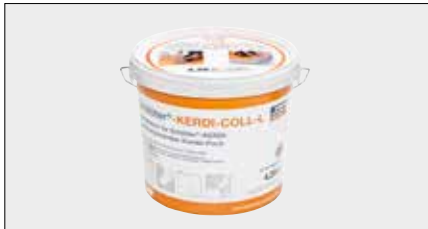
Schlüter®-KERDI-COLL-L is een tweecomponenten afdichtingslijm op basis van een oplosmiddelvrije acrylaatdispersie en een reactief poeder van het cementtype. Het is bedoeld om overlappingsen en naadverbindingen van Schlüter-KERDI stroken vast te lijmen en af te dichten.