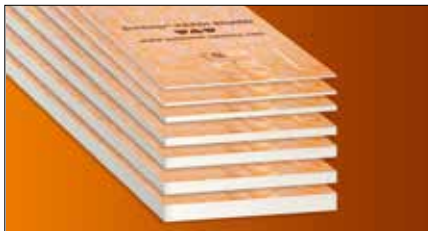
Schlüter®-KERDI-BOARD is een universele plaatsingsondergrond voor tegels op gelijk welk type wand, ook direct als contactafdichting. Schlüter-KERDI-BOARD is ook geschikt als ondergrond voor plamuur- en stukadoorsmortel.